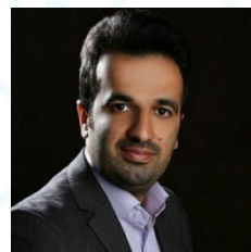
دکتر روح الله باقری مجد